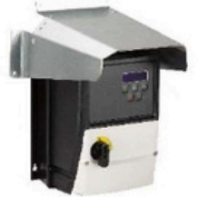
Option casquette pour montage en toiture